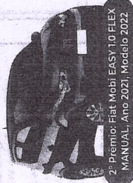
2º Prêmio: Fiat Mobi EASY 1.0 FLEX MANUAL, Ano 2021, Modelo 2022

Sorteio 30/11/2022 pela extração da Loteria Federal